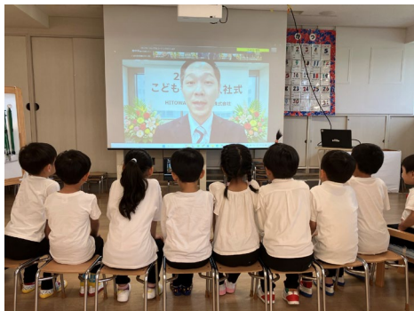
入社式に参加する園児たち